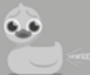
NIEUWS VAN DE AFDELINGEN