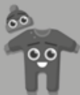
WIE IS WIE